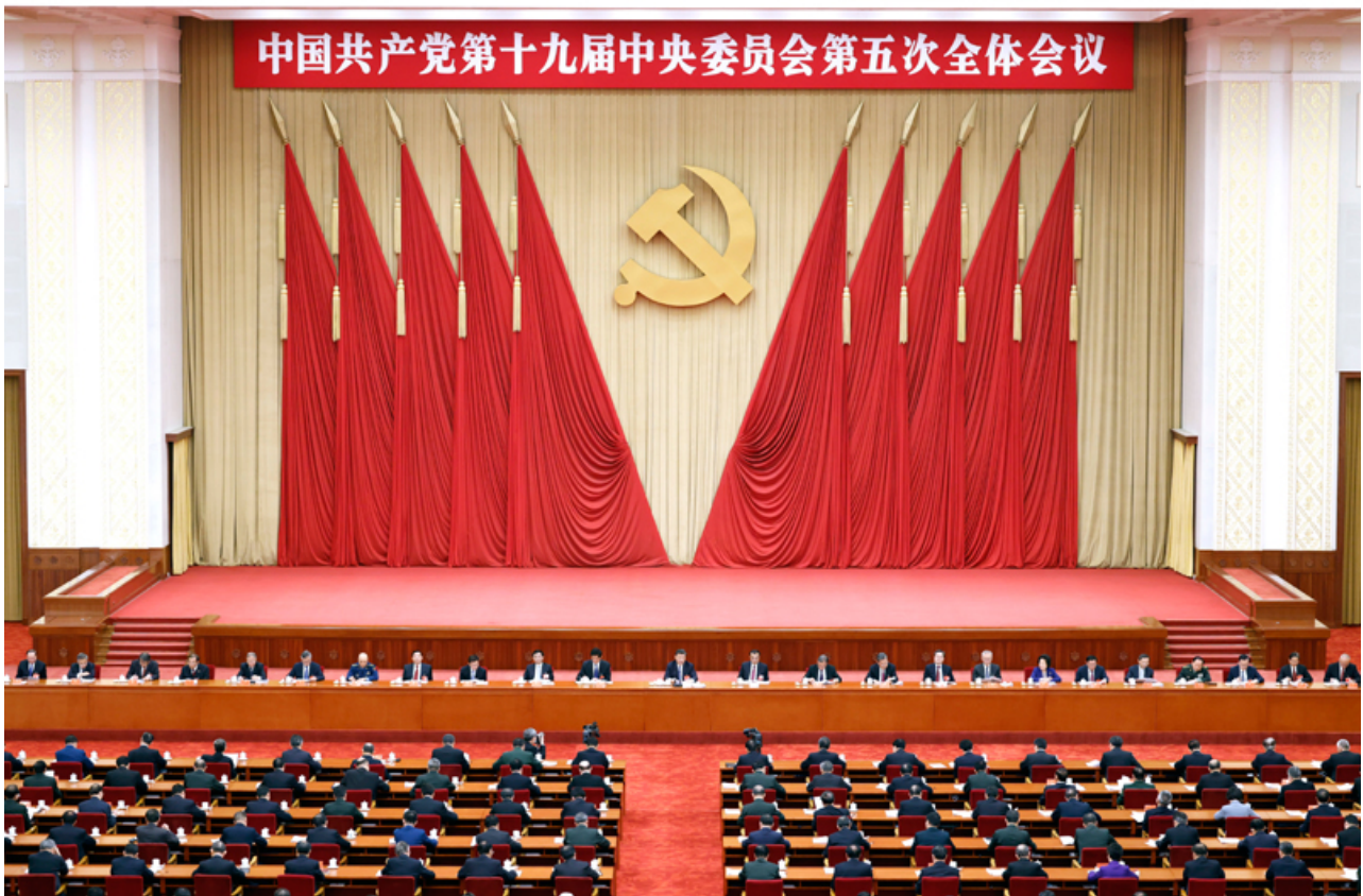
中国共产党第十九届中央委员会第五次全体会议，于2020年10月26日至29日在北京举行。

全会深入分析了我国发展环境面临的深刻复杂变化，认为当前和今后一个时期，我国发展仍然处于重要战略机遇期，但机遇和挑战都有新的发展变化。当今世界正经历百年未有之大变局，新一轮科技革命和产业变革深入发展，国际力量对比深刻调整，和平与发展仍然是时代主题，人类命运共同体理念深入人心，同时国际环境日趋复杂，不稳定性不确定性明显增加。我国已转向高质量发展阶段，制度优势显著，治理效能提升，经济长期向好，物质基础雄厚，人力资源丰富，市场空间广阔，发展韧性强劲，社会大局稳定，继续发展具有多方面优势和条件，同时我国发展不平衡不充分问题仍然突出，重点领域关键环节改革任务仍然艰巨，创新能力不适应高质量发展要求，农业基础还不稳固，城乡区域发展和收入分配差距较大，生态环保任重道远，民生保障存在短板，社会治理还有弱项。全党要统筹中华民族伟大复兴战略全局和世界百年未有之大变局，深刻认识我国社会主要矛盾变化带来的新特征新要求，深刻认识错综复杂的国际环境带来的新矛盾新挑战，增强机遇意识和风险意识，立足社会主义初级阶段基本国情，保持战略定力，办好自己的事，认识和把握发展规律，发扬斗争精神，树立底线思维，准确识变、科学应变、主动求变，善于在危机中育先机、于变局中开新局，抓住机遇，应对挑战，趋利避害，奋勇前进。