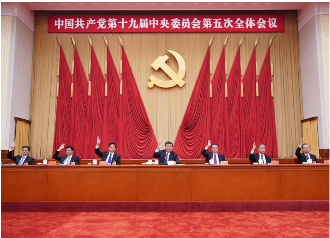
中国共产党第十九届中央委员会第五次全体会议，于2020年10月26日至29日在北京举行。这是习近平、李克强、栗战书、汪洋、王沪宁、赵乐际、韩正等在主席台上。新华社记者 王晔 摄

全会高度评价决胜全面建成小康社会取得的决定性成就。“十三五”时期，全面深化改革取得重大突破，全面依法治国取得重大进展，全面从严治党取得重大成果，国家治理体系和治理能力现代化加快推进，中国共产党领导和我国社会主义制度优势进一步彰显；经济实力、科技实力、综合国力跃上新的大台阶，经济运行总体平稳，经济结构持续优化，预计二〇二〇年国内生产总值突破一百万亿元；脱贫攻坚成果举世瞩目，五千五百七十五万农村贫困人口实现脱贫；粮食年产量连续五年稳定在一万三千亿斤以上；污染防治力度加大，生态环境明显改善；对外开放持续扩大，共建“一带一路”成果丰硕；人民生活水平显著提高，高等教育进入普及化阶段，城镇新增就业超过六千万人，建成世界上规模最大的社会保障体系，基本医疗保险覆盖超过十三亿人，基本养老保险覆盖近十亿人，新冠肺炎疫情防控取得重大战略成果；文化事业和文化产业繁荣发展；国防和军队建设水平大幅提升，军队组织形态实现重大变革；国家安全全面加强，社会保持和谐稳定。“十三五”规划目标任务即将完成，全面建成小康社会胜利在望，中华民族伟大复兴向前迈出了新的一大步，社会主义中国以更加雄伟的身姿屹立于世界东方。