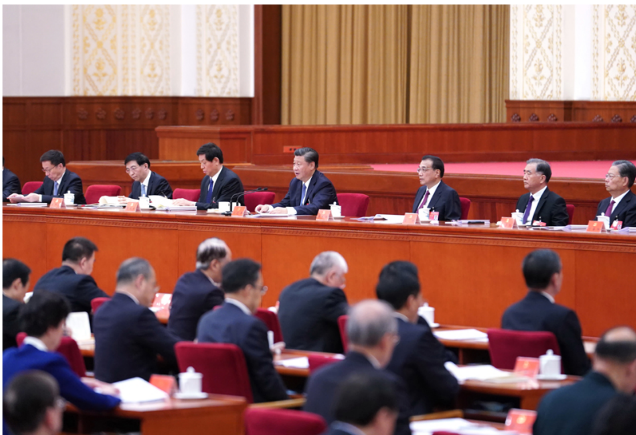
中国共产党第十九届中央委员会第五次全体会议，于2020年10月26日至29日在北京举行。这是习近平、李克强、栗战书、汪洋、王沪宁、赵乐际、韩正等在主席台上。

居民收入增长和经济增长基本同步，分配结构明显改善，基本公共服务均等化水平明显提高，全民受教育程度不断提升，多层次社会保障体系更加健全，卫生健康体系更加完善，脱贫攻坚成果巩固拓展，乡村振兴战略全面推进；国家治理效能得到新提升，社会主义民主法治更加健全，社会公平正义进一步彰显，国家行政体系更加完善，政府作用更好发挥，行政效率和公信力显著提升，社会治理特别是基层治理水平明显提高，防范化解重大风险体制机制不断健全，突发公共事件应急能力显著增强，自然灾害防御水平明显提高，发展安全保障更加有力，国防和军队现代化迈出重大步伐。