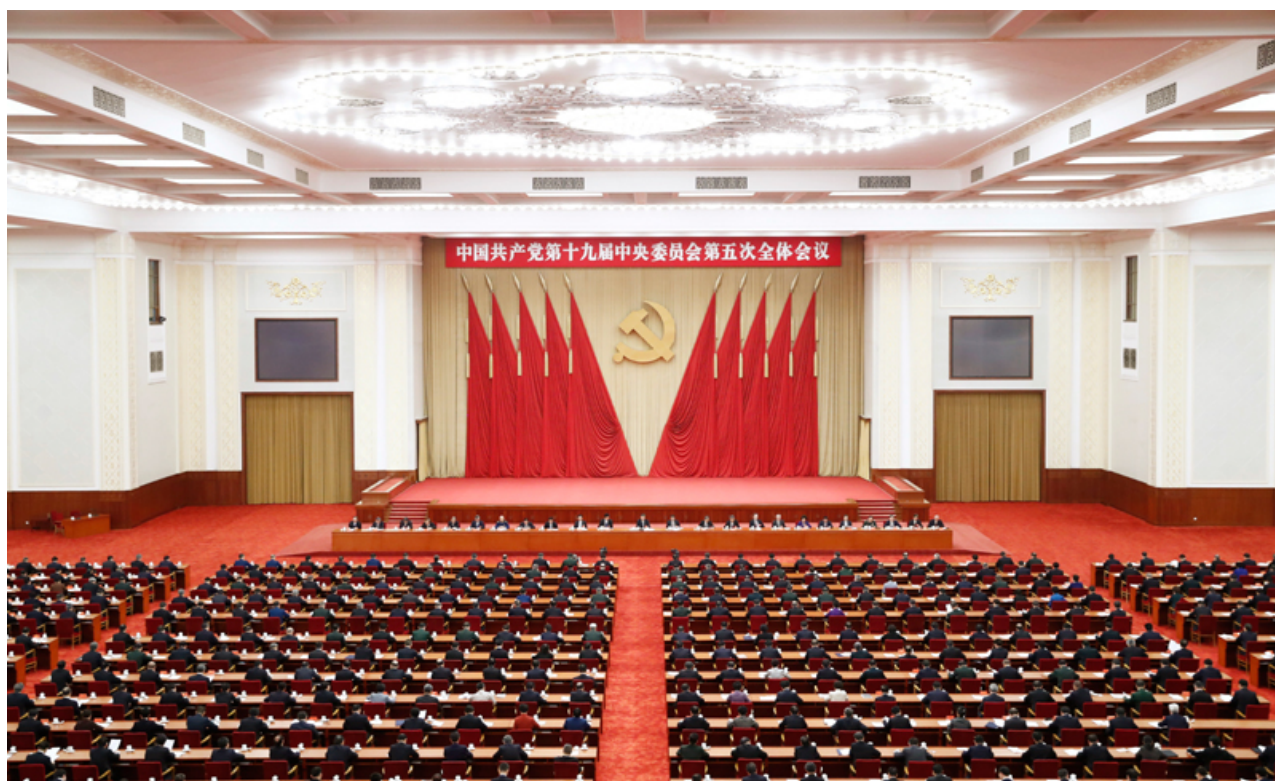
中国共产党第十九届中央委员会第五次全体会议，于2020年10月26日至29日在北京举行。

全会提出，加快国防和军队现代化，实现富国和强军相统一。贯彻习近平强军思想，贯彻新时代军事战略方针，坚持党对人民军队的绝对领导，坚持政治建军、改革强军、科技强军、人才强军、依法治军，加快机械化信息化智能化融合发展，全面加强练兵备战，提高捍卫国家主权、安全、发展利益的战略能力，确保二〇二七年实现建军百年奋斗目标。要提高国防和军队现代化质量效益，促进国防实力和经济实力同步提升，构建一体化国家战略体系和能力，推动重点区域、重点领域、新兴领域协调发展，优化国防科技工业布局，巩固军政军民团结。